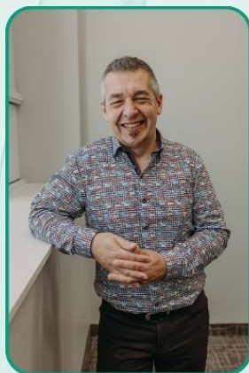
FRANCIS WURTZ VICE-PRÉSIDENT