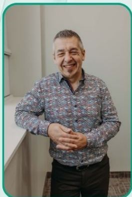
FRANCIS WURTZ VICE-PRÉSIDENT